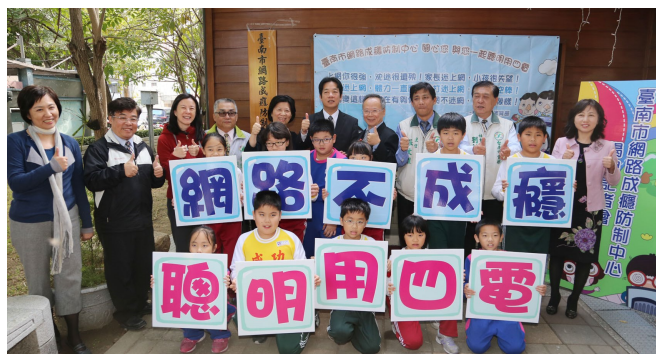
圖說：台南市網路成癮防制中心成立，設諮詢專家提供家長與教師諮詢服務。