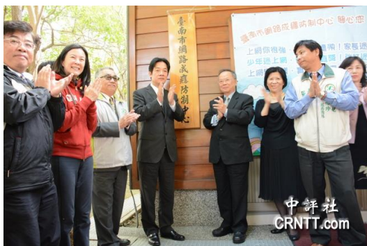
圖說：台南市長賴清德主持全台灣第一個直轄市級的網路成癮防制中心揭牌儀式。