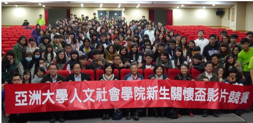
圖說：亞洲大學人社院第三屆新生關懷盃競賽合影。

主辦單位核算結果，社工系的點閱錄最高，超過1500人次；外文系現場粉絲最多，由社工系拿到最高分奪冠。