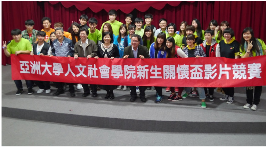
圖說：亞洲大學人社院第三屆新生關懷盃競賽合影。