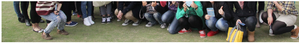
圖說：亞大語發中心的英語情境旅遊節，師生們熱情參與英語情境旅遊節。