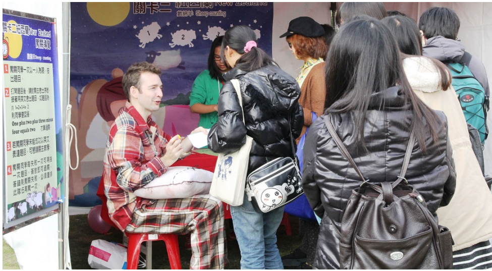
圖說：亞大語發中心的英語情境旅遊節，關卡之一：紐西蘭英語數綿羊(New Zealand)。