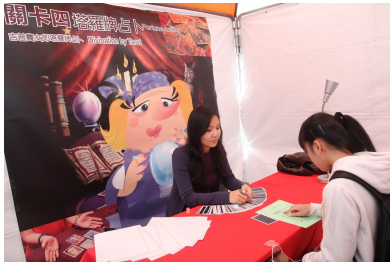
圖說：亞大語發中心的英語情境旅遊節，關卡之一：塔羅牌占卜(Fortune-telling)。

亞大舉辦英語情境旅遊節，安排6個英語主題闖關活動，還有跳蚤市場、下午茶等活動，增強學生英語文。