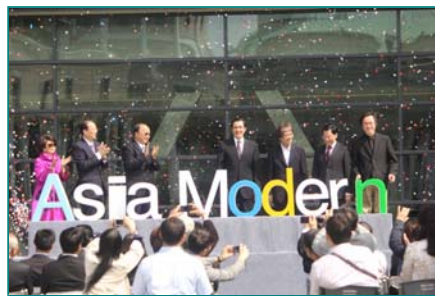
圖說：亞洲大學安藤美術館正式開館，由總統馬英九(中)、建築大師安藤忠雄(右

安藤大師致詞時，現場發生一段小插曲，因為風勢過大，將原本覆蓋於美術館的紅布幔吹落，迫使美術館提前揭幕；不過，安藤大師以愉快的語氣化解說：「在台灣常會發生驚喜的事！」、「不過，這也是台灣的特色，也很令人期待！」