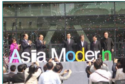
圖說：亞洲大學安藤美術館正式開館，由總統馬英九(中)、建築大師安藤忠雄(右

安藤大師致詞時，現場發生一段小插曲，因為風勢過大，將原本覆蓋於美術館的紅布幔吹落，迫使美術館提前揭幕；不過，安藤大師以愉快的語氣化解說：「在台灣常會發生驚喜的事！」、「不過，這也是台灣的特色，也很令人期待！」