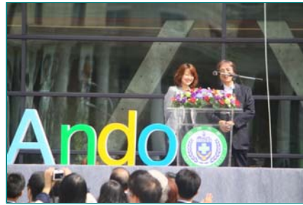
圖說：「亞洲大學安藤美術館」開館，日本國際建築大師安藤忠雄到場致詞。

亞洲大學安藤美術館開館，馬總統、安藤大師、台中市長胡志強及蔡長海創辦人揭幕，宣告亞大開始走向國際、走向世界。