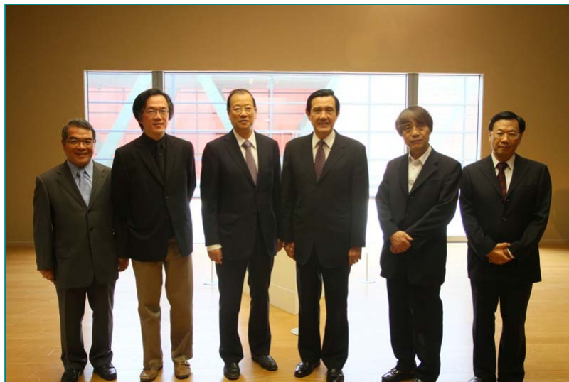
圖說：亞洲大學安藤美術館正式開館，總統馬英九(右三)、建築大師安藤忠雄(右二)、亞洲大學創辦人蔡長海(左三)等人一同合影。