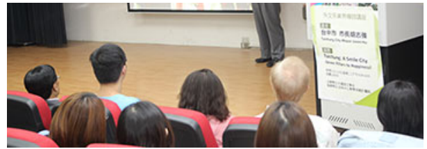
圖說：台中市長胡志強受邀到亞洲大學當業界教師，全程用英文授課。

要有多快樂，就有多快樂。」“People are just as happy as they make up their minds to be”，胡市長說，很多人問他，為何要幽默？他認為「是因為喜歡看見大家的笑容！」至於為何要從