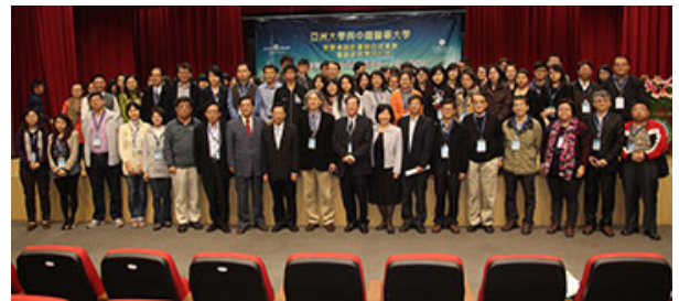
圖說：亞洲大學與中國醫藥大學教學卓越計畫聯合成果展暨創新教學研討會，所有與會人士合影。

長庚大學講座教授黃寬重以「建立新典範：跨領域教育規劃、執行的反思與期待」為題演講，他說，人才是移動，必須強化跨領域的整合，重塑競爭力，培養國際視野、專業能力，國內各大學培育人才，不能只圖在本地找工作，應著眼在全球國