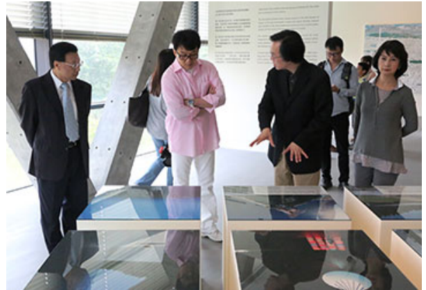
圖說：國際巨星成龍是在亞洲大學校長蔡進發（左一）陪同、副校長劉育東解說下，參觀亞大安藤美術館。

成龍對安藤建築的「清水模工法」很有興趣，頗專注欣賞，受到建築之美的激盪，成龍一時興起，請助理拿出電腦，當場就和胡志強市長、蔡長海創辦人等人，大方分享他在大陸、世界各地看過的藝術品、特殊建築及傳統的老房子等，談論建築之外，同時講述他的設計與藝術品等多項的收藏，胡志強市長等人聽得津津有味。