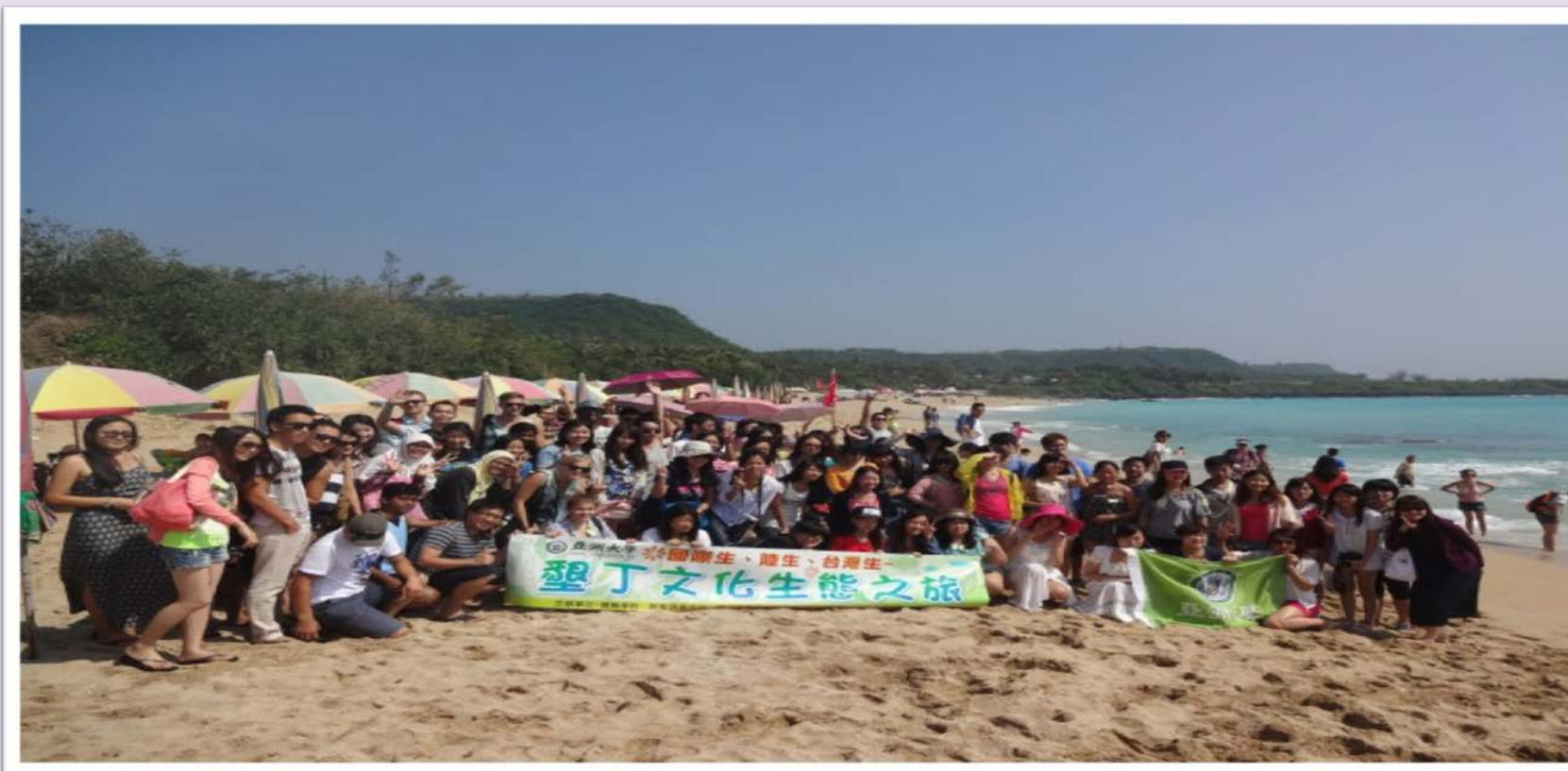
圖說：國際生、陸生及本地生於墾丁白沙灣合影

國際學院協同創意領導中心以及語發中心，共同辦理外籍生、陸生與本地生墾丁文化生態之旅。活動於 102 年 10 月 5、6 日舉行。兩天一夜的行程共有 130 位師生共同參加。本次活動參觀景點豐富，如台灣著名景點墾丁國家公園、大鵬灣風景區及佛光山佛陀紀念館等。透過此次活動，希望能讓外籍生及陸生融入台灣文化。