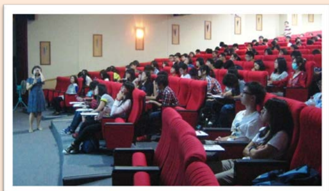
圖說：2013 諾貝爾獎得主李維特教授曾到亞洲大學演講。

亞洲大學學涯中心 10 月 9 日下午舉辦 102 學年度「品牌實習/保證就業」培訓專案說明會，由學涯中心主任龐玉涓主持，除了向大一同學說明「品牌實習/保證就業」培訓專案的課程設計外，龐玉涓主任也勉勵符合參與該專案培訓條件的同學，在大學四年好好投資自己，藉由培訓課程的系統性學習與實習，累積資本，掌握職場知能，畢業即就業。