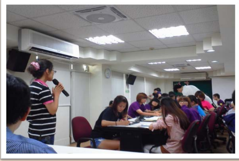
圖說：彰化區婦幼福利服務中心為亞大學生講解

於 102 年 10 月 14 日社工系安排參訪的機構有：南投縣基督教青年會、南投法院家事服務中心(勵馨基金會南投服務中心承辦)、立達啟能訓練中心、中國醫藥大學附設醫院社工部、財團法人彰化基督教醫院社工部、彰化區婦幼福利服務中心、彰化縣外籍配偶家庭服務中心等七個機構，依地區分配為台中線、南投線、彰化線，於同一時間三條路線同時進行參訪。