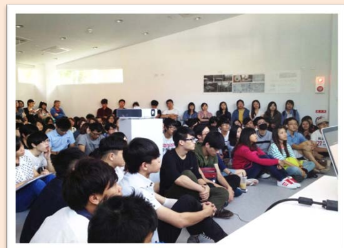
圖說：現場學生專心聽講，認真學習