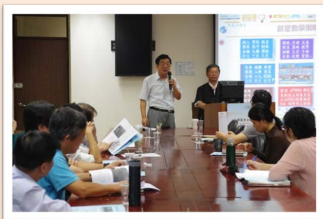
圖說：發中心卓播英主任感謝老師出席陳龍安教授之實例工作坊

本校於 102 年 10 月 03 日邀請實踐大學企業管理系陳龍安教授蒞校指導，舉辦「創意教學法應用在課程設計之實例工作坊(一)」，此活動為九宮格思考法又稱曼陀羅法，參與人數踴躍，本場師長共計 53 人。