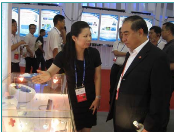
圖說：華僑大學校長賈益民(右)由亞洲大學創意商品設計系劉芃均老師介紹，帶領參訪亞大產品。

福建省經濟貿易委員會技術進步處副處長陳亮，還當面邀請亞洲大學參與2013年9月份舉辦的「海峽杯」福建(晉江)工業設計大賽的設計比賽。福建省經濟貿易委員會副主任曹建平說，期盼兩岸今後合作培養工業設計人才，能夠實現資源分享與優勢互補。