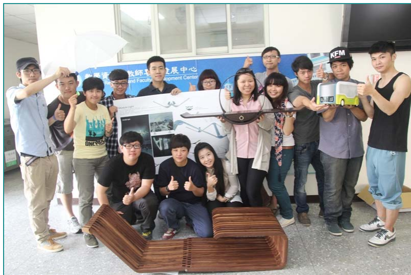
圖說：亞洲大學創意設計學院應屆畢業生參加第32屆「新一代設計展」，商設系應屆畢業生有7件畢業作品入圍新一代設計獎工藝類、產品設計類。

「新一代設計展」是國內最悠久、全球規模最大以學生設計新秀作品為主的展覽，今年「新一代設計展」，以「美夢成真Have a Sweet Dream!」為題，5月17日至20日在臺北世貿中心一館及三館展出，邀請國內58校131系、國際6國20所設計院校及國內設計廠商，超過8400位學生參賽，盛況空前。