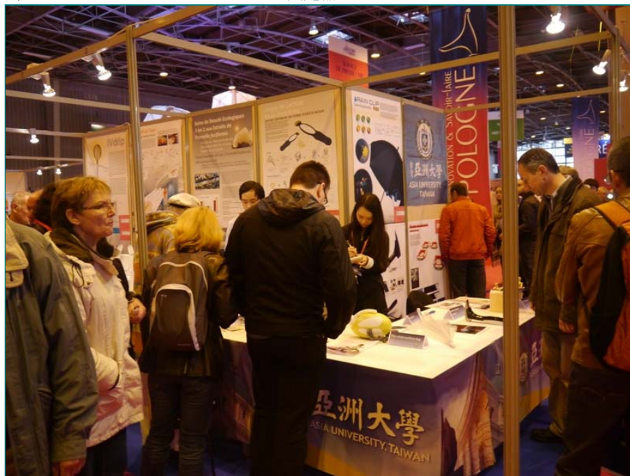
圖說：亞洲大學參加法國巴黎發明展12天，每天吸引大批法國民眾參觀。