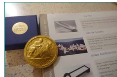
圖說：第112屆法國巴黎國際發明展金牌。