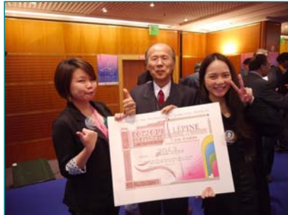
圖說：亞洲大學獲大滿貫，開心與法國巴黎台北代表處大使呂慶龍合影。

亞大學生參加瑞士日內瓦、法國巴黎、馬來西亞等三大國際發明展，揮出漂亮成績單，共獲37面獎牌，都是台灣團中大贏家。