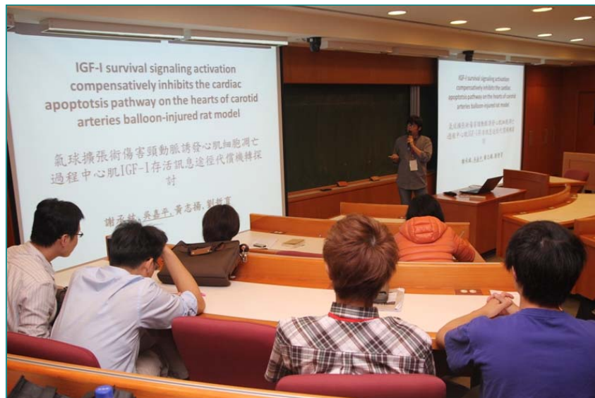
圖說：亞大、中醫大碩士生發表論文，分享研究成果。

13日下午，亞大、中醫大兩校合作平台各主持人，分別在亞洲講堂A115室、A116室共同發表各平台研究成果，共43篇論文，一起分享研究成果。