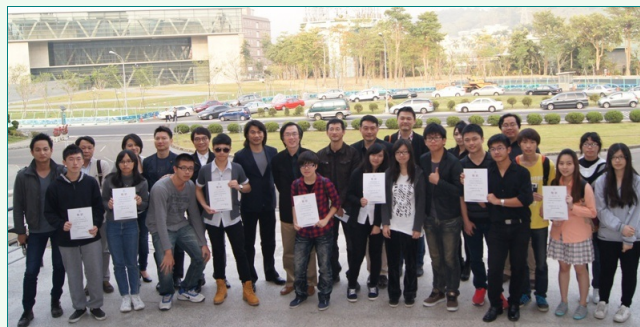
圖說：亞洲大學辦亞洲大學安藤忠雄藝術館候車亭概念競賽，評審與得獎者一同合照。