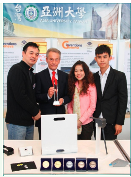
圖說：亞大創意設計暨發明中心與瑞士日內瓦國際發明展主席(左二)合影。