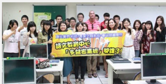
圖說：語文中心這學期開辦的英檢加強班，已成為同學口碑相傳的必選課程。

據統計，亞洲大學陸續開辦23班英語密集加強班，共有400位學生報名參加，不只為學生節省50萬元考試報名費，更省下了約400萬元的校外補習費。學生不僅可在校園免費享受英語證照課程，又可避免舟車勞頓之苦，繞遠路到至台中市區補習英語。