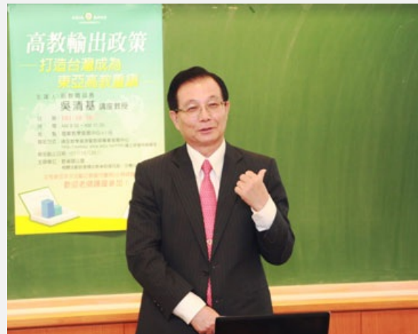
圖說：前教育部長吳清基到亞洲大學演講，暢談如何打造台灣成為東亞高教重鎮。

至於陸生來台就學問題，吳清基教授建議，陸生來台就學政策推展，國人反應比預期良好，原訂「三限六不」原則，因時空環境有改變，應做全面檢討。教育部可會同陸委會、勞委會、衛生署速確定可行方式，於101年底前讓陸生可擔任兼任研究助理、報考能力專業證照考，並參加健保；教育部可考慮認可大陸211工程大學、示範專科學校，釋出我方對等善意，也期待陸方開放示範專科畢業生來台升二技、六省市以外學生及三本線