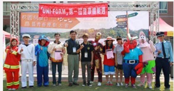
圖說：亞大健康體育週登場，有草地躲避球競賽、亞大制服日及漆彈生存戰。