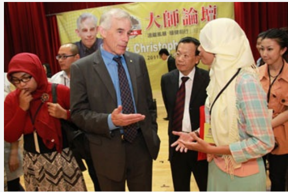
圖說：諾貝爾經濟學大師席姆斯博士(左二)與亞洲大學國際生互動熱絡。

前財政部長暨前駐WTO大使顏慶章指出，目前台灣的財政狀況，雖差強人意，但也不能掉以輕心，台灣過度仰賴中國市場，不久的將來，一旦中國面臨發展瓶頸，對台灣會有不利的