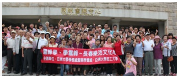
圖說：竹山樂齡中心、台中市大里青松養護之家70多位阿公、阿嬤們參加樂活之旅。

阿公、阿嬤們隨後轉往霧峰酒莊，參觀製酒過程、品酒及霧峰地區特產—香米；酒莊人員介紹說，這裡的清酒是邀清日本首席的釀酒師駐台傳授釀造技術，除了釀酒廠，酒莊本身仍保留了