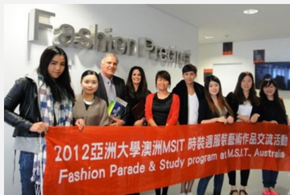
圖說：時尚系師生到澳洲布里斯班參加時裝週的服裝藝術作品交流。

澳洲大都會南TAFE學院時裝週7月26日在布里斯班登場，這是一場集合全球時尚設計精彩服裝藝術作品交流，讓時尚系師生大開眼界，體驗令人震撼的設計創新與活力；並與來自世界各地設計菁英，一起體驗澳洲流行界的時尚設計饗宴。