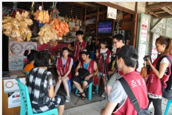
圖說：國企系國際志工團拜訪台灣媳婦的大灣肚娘家，錄製媽媽給遠嫁台灣女兒的叮嚀祝福！

國企系主任李偉權強調，此次到印尼展開國際志工服務，不但拓展國際視野，也實際運用所學的分析與解決問題能力及資訊應用，發揮團隊精神，善盡國際社會一份子的責任。山口洋市(Singkawang)是印尼華人聚居的城市，當地有超過3萬5,000名