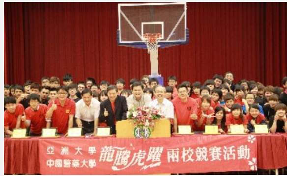
圖說：中國醫藥大學與亞洲大學學生舉辦「龍騰虎躍」體育交流活動。

績效，如亞洲大學世界級的「菇類研究中心」所研發的新品種菇類、彩色白木耳等產品，經過中國醫藥大學進行動物實驗，初步可抗7種癌症；另外，創設「中亞聯大網路成癮防治中心」，將開設全國唯一「網路成癮門診」。兩校師生團隊在教學、研究與服務方面，都有合作成效。