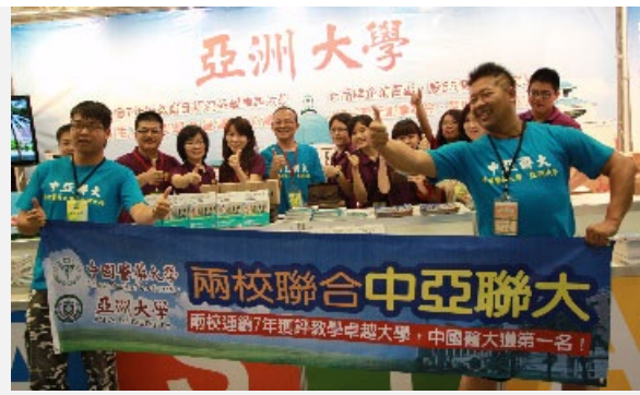
圖說：中國醫藥大學、亞洲大學結為「中亞聯大」，亞大師生在大學博覽會攤位上高喊：「中亞聯大！讚！讚！」

，但校務發展迅速，已連續7年獲教育部評為教學卓越大學，且師資堅強，如聘前衛生署長楊志良、蕭青陽設計師、前考試院副院長吳容明等業界名師，學生人數更達1萬3千多人，10年內逆勢成長10倍，成為國內大學閃亮的新星，尤其在創意設計、生物科技與資訊、半導體、健康政策方面的表現更為突出。