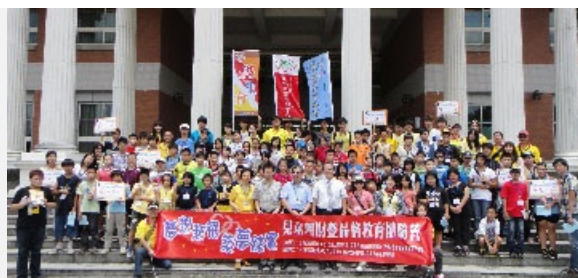
圖說：亞洲大學、台中市家扶中心在亞洲大學舉辦「夢想起飛-築夢踏實」兒童理財暨品格教育體驗營，與會人員大合照。

生們的志願服務外，由臺中市南區家扶中心扶幼委員會及各界善心人士贊助經費，讓活動順利舉辦，觸發小朋友不一樣的感受，同時寓教於樂，讓兒童們獲得寶貴的理財知識，也學到良好的品格教育。