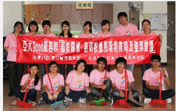
圖說：亞洲大學good服務群成員到台中市惠明盲童育幼院協助打掃。

此外，亞大幼教系綠島服務隊15位同學，8月22日至29日將到台東縣綠島公館國小舉辦「夏日綠悠悠」夏令營，吸引160多位小