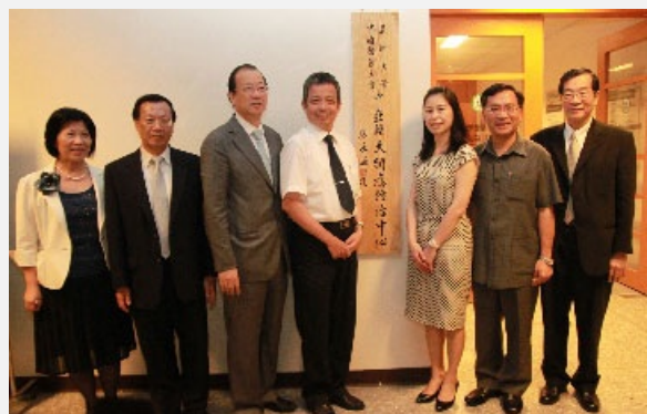
圖說：中亞聯大網路成癮防治中心，在教育部常務次長陳德華（中）、衛生署醫事處副處長王宗曦、臺中市副市長蔡炳坤（右二）、亞洲大學創辦人蔡長海（左三）等人見證下揭牌！

中醫大學與亞大24日上午舉辦「中亞聯大網路成癮防治中心」揭牌儀式，是兩校結為聯合大學，第一個學術合作的特色；教育部常務次長陳德華說，網路成癮是現在的家長們最擔心孩子項目之一；教育部曾委託交大等校進行研究調查，發現五分之一國中生、三分之一高中生都有網路成癮。孩子沉迷於網路，除了與家人間的關係生疏，也引發許多社會問題；現在正值暑假，學生大多在家中長時間上網；該部樂見中亞聯大成立「網路成癮防治中心」，在兩校專業的研究、合作下，能針對網