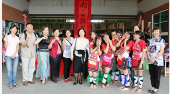
圖說：幼教系舉辦第一屆「幼！教你一定要營！」暑期營，吸引高中職生參加。

兒餐點與營養」，現場準備麵粉、小蘇打、奶油等材料，讓所有學員現場DIY，製作明治抹茶餅乾，多數的學員第一次DIY手工餅乾，無不興趣高昂，尤其吃到自己調作的餅乾，都大呼：「超好吃的！」