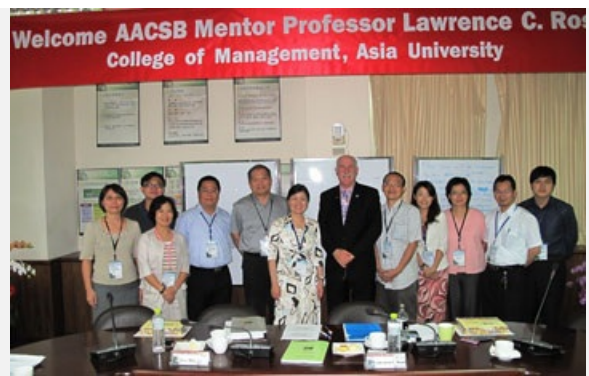
圖說：國際商管學院促進協會（AACSB）顧問勞倫斯·羅斯教授與亞洲大學管理學院師長們合影。

羅斯教授指出，他深刻感受到亞洲大學不斷的成长與進步，也肯定管理學院及各學系所做的努力，期許管理學院能不斷的精