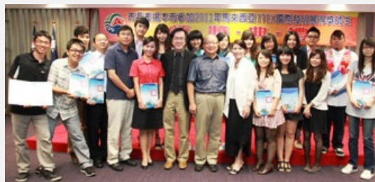
圖說：亞洲大學發明團隊與台中市長胡志強（中）合影。

胡市長表示，這位小朋友的問題很犀利，讓他當場愣住，差一點被問倒；但是他即回答，小朋友上學的學校有冷氣、視訊設備，有瓦斯可以烤麵包，都是上一代的人上學發明的結果，如果小朋友不上學就很難進步，如果不上學就難有發明，「沒有發明，就沒有文明」。