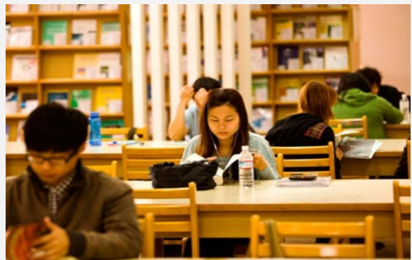
圖說：亞洲大學提供優良、舒適的就學空間，讓學生安心求學。

朱發言人說，上月28日，監察委員趙榮耀、尹祚芊，由教育部高教司司長何卓飛陪同，訪視亞洲大學後，兩位監委指出，亞洲大學10年來學生人數成長10倍為1萬2千人，不但受少子化影響，且是少數進步神速的大學，尤其是招生逆勢成長的成功經驗，是新設大學的標竿，教育部可將亞洲大學努力的績效，