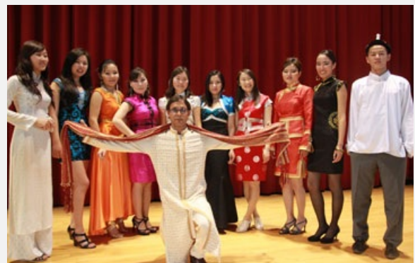
圖說：就讀亞洲大學的國際學生穿著傳統、亮麗服飾走秀。

亞洲大學總務處等行政單位也開始執行「英語窗口」，讓國際生在亞大求學，除了課業、教學及研究外，也受到適適的生活輔導，如就醫、買日常用品、搭車旅遊等。亞洲大學國際副校