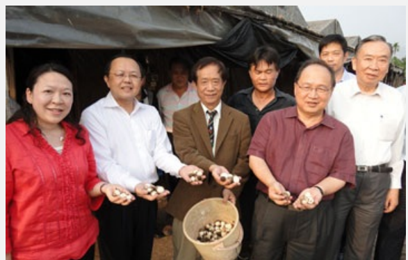
圖說：馬來西亞聯邦政府部長Tan Sri Bernard Giluk Dompok（左四）參觀菇類栽培設施。