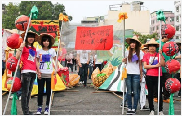
圖說：亞洲大學師生扛著創意神轎、旗幟、涼傘參加旱溪媽祖遶境霧峰活動。

此次活動，是由霧峰區阿罩霧文化基金會結合休憩系的「文化創意產業」、「Event Management」（文化節慶活動）兩門專業課程及社工系的「霧峰學·學霧峰」、「地方文化與智慧社群」兩門通識課程，指導亞大同學們在學校工作坊集體創作，以創意神轎（如民俗八家將臉譜、霧峰五大地標）展現。這是