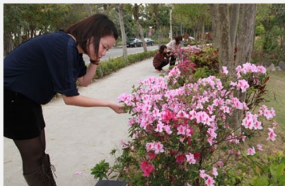
圖說：亞洲大學舉辦以「杜鵑與玫瑰的約會」為主題的花季，盛開杜鵑花吸睛。

朱總務長說，東方的中國、台灣、日本喜愛杜鵑，西方歐美喜愛玫瑰，此時在亞洲大學，這兩種花盛開；因學校有國際學院，來自12個國家學生，所以校園的「杜鵑與玫瑰的約會」花季，有如「東西方學生的交流與沈思」；加上校內有羅丹的「沈