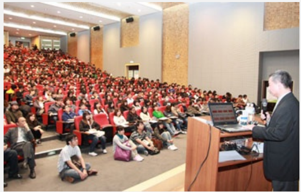
圖說：亞洲大學講座教授楊志良返校演講，同學擠爆現場，繼續宣導防疫！

楊志良教授指出，台灣流感流行每年約自10月開始，於12月至隔年月進入高峰，3月後才逐漸下降。死亡率估計每10萬人約20.1，換言之，全台灣每年約有4000多人死亡。其中，八成死亡是65歲以上老人；不過，自從H1N1新型流感出現後，年