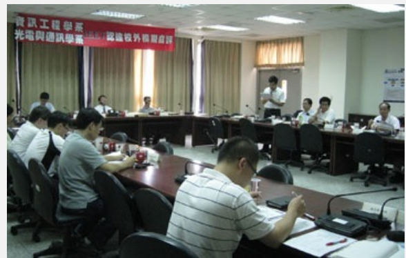
圖說：亞洲大學光通系、資工系參加中華工程教育學會 I E E T 認證，獲得通過。

亞洲大學91年8月成立資訊科技學系，同時招收大學部、碩士班及在職碩士班學生，93學年度改名為資訊工程學系，94學年度成立外籍全英文碩士班，成立兆赫電子、華邦電子、世界先進等產碩專班、招收外籍碩士班，積極進行國際學術交流。95學年度成立博士班，資工系並於97學度順利通過大學校院系所評鑑。