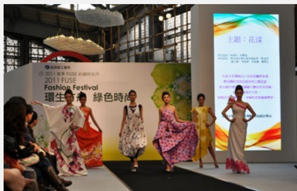
圖說：亞洲大學時尚系北上參加「2011春季FUSE紡織時尚月」上台走秀。

此外，時尚系師生再利用省水、低碳、節能的綠色環保數位印花及藍染技術，以花博花卉為主題，將花卉轉化為印花設計，並以結合禮服款式設計，展現花卉婀娜多姿、多樣的造型視覺饗宴，經由時尚系學生專業走秀表演，整場精彩絕倫，備受好評。