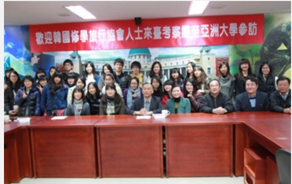
圖說：韓國修學旅行協會人士來臺考察學生團到亞洲大學參訪。

聞創校僅10年的台灣亞洲大學，辦學績效卓越、各項評比優等，擠身優秀公私大學之林，且聽說校園漂亮，「百聞不如一見」，很開心能帶領高中生來台灣亞洲大學參觀亞洲大學，一睹真面目。