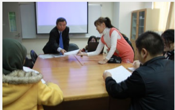
圖說：前衛生署長楊志良卸下職務，重返亞洲大學任教。