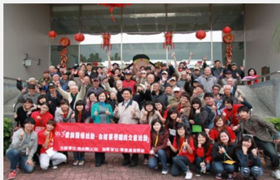
圖說：亞洲大學服務學習領導幹部一行人，南下白河榮譽國民之家展開服務。

亞洲大學學務處邀集服務與學習課程現任幹部、見習儲備幹部、服學組教職員及志工夥伴61人，分批前往白河榮譽國民之家、蓮心園啟智中心展開校外學習服務。由於兩個機構是亞洲大學長期駐點服務的機構，去年就辦過關懷活動，因此，不論是