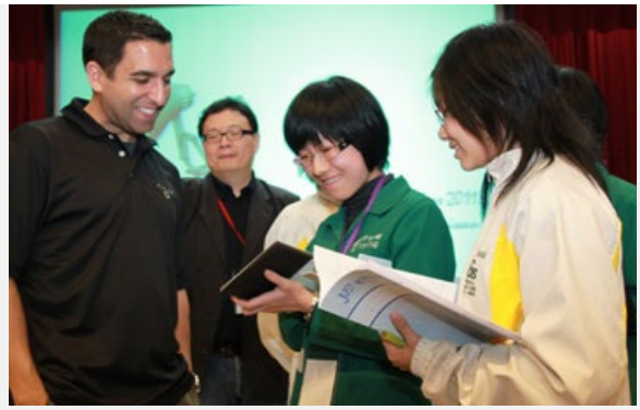
圖說：國際知名皮克斯動畫公司總監安德魯·高登（左）與聆聽演講的高中生們愉快互動！

「親近大師的教學，收穫滿滿，對動畫更有深入一層的認識！」國立臺中女中曹詩瑩、謝麗伶說，安德魯總監演講的內