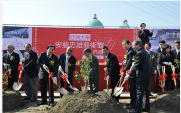
圖說：亞洲大學安藤忠雄藝術館動土典禮，安藤忠雄大師（中）與副總統蕭萬長、台中市長胡志強及亞洲大學創辦人蔡長海等人動鏟植樹。

蔡創辦人指出，亞洲大學的創立，是已故林增連創辦人與他共同的夢想：「要創立一所有特色的卓越學校」。10年來，在全體師生的努力下，創下教育部私校籌備最快、改名大學最快、系所評鑑全數一等、連續5年獲得教學卓越大學。安藤忠雄館的動土，雖有番波折，終在本土德昌營造與日本清水模專業團隊共同努力下，將於500天後完成；這種不怕挑戰，勇於堅持的信念，正是亞洲大學要以身作則，示範於學生、社會的勇氣與毅力。此館的綠能概念，也代表身為地球村的台灣人們對於地球許下的承諾。未來此館除了法國羅丹等大師藝術品的陳列，更要收藏本土藝術家作品，作為對本土藝術的支持，「我將全力以赴完成此館興建！