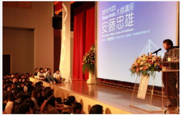
圖說：國際知名建築師安藤忠雄大師蒞校演講，談他夢想的追尋，到場聽講來賓擠滿現場！

「建築是要保護人，要美麗、要安全，最重要是要讓裡面使用者愉快，甚至可以進行心靈溝通！」他希望更多願意追求美感、力量的學生或藝術家都能來到亞大參觀、創作。