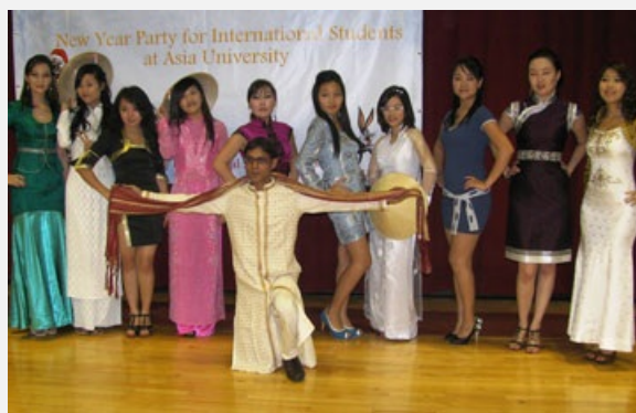
圖說：亞洲大學國際學生穿著各國籍的傳統服飾上台走秀，掌聲、尖叫聲四起。

接著亞洲大學黑泡泡熱舞社上號台表演勁歌熱舞，她們舞動身軀、動感十足的酷炫演出，立即帶動全場HIGH起來，炒