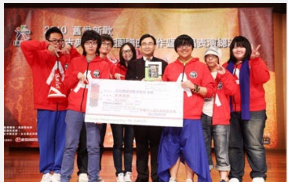
圖說：亞洲大學aplusA人聲樂團參加全國校園譜曲創作暨歌唱表演賽，獲優等獎。

「一曲陽關情幾許，知君欲向秦川去，白馬皂貂留不住，回首處，孤城不見天霧霧。到日長安花似雨，故關楊柳初飛絮，漸見靴刀迎夾路，誰得似，風流膝上王文度。」