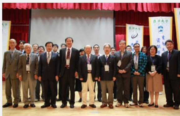
圖說：第六屆台灣數位學習發展研討會暨第五屆文學與資訊技術國際研討會在亞洲大學登場。

蔡校長指出，雖然先進的資訊技術在現今社會中廣為應用，但截至目前為止，資訊技術應用在文學研究，大部分仍侷限於搜索關鍵語及製作索引，合作式學習、Web2.0（網頁技術）應用