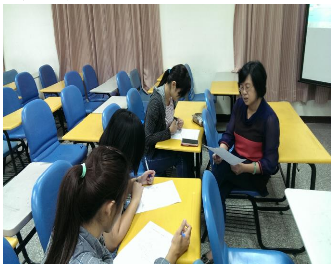
老師與同學在導讀後並作分享